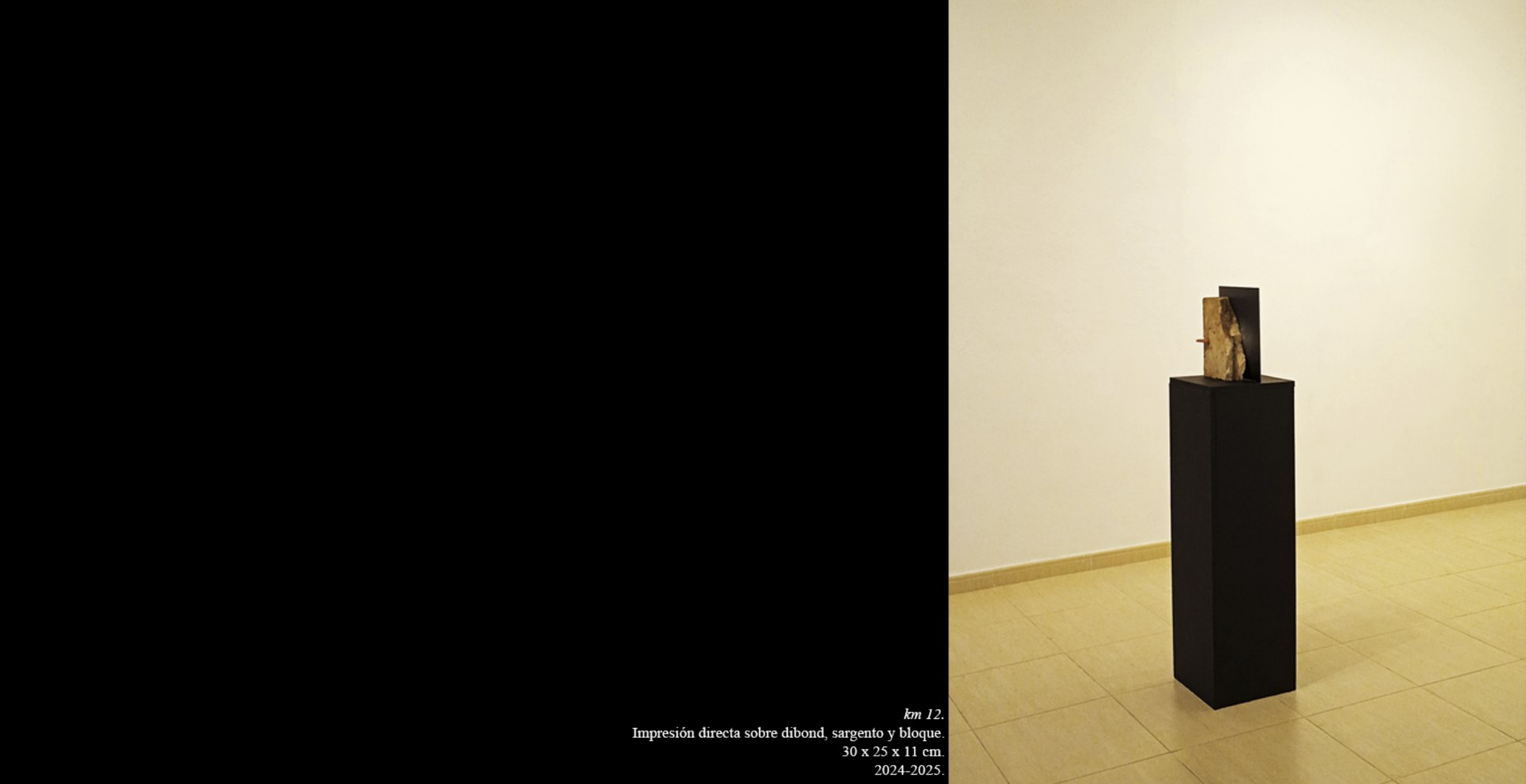
km 12. Impresión directa sobre dibond, sargento y bloque. 30 x 25 x 11 cm. 2024-2025.