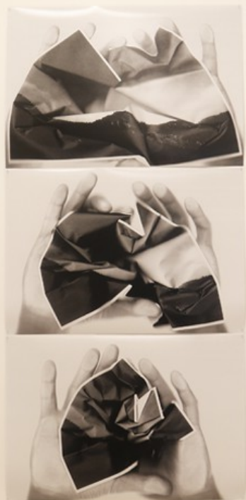
Proceso de modificación de un lugar. Fotografía. Impresión lambda. 50 x 210 cm. 2017