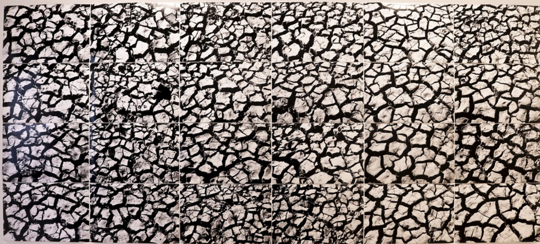
10%. Fotografía. Impresión lambda. 200 x 450 cm. 2023.